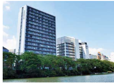
東京理科大学神楽坂キャンパス

東京理科大学の研究室との共同研究や「夏期集中講義」、「語学研修プログラム」での学生同士の交流も、新たな視点の発見につながります。