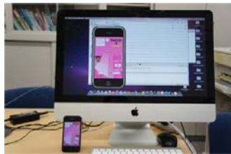
スマートフォンアプリケーション