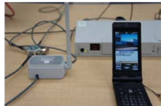
ワンセグ放送システム