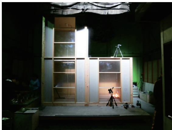
燃焼時のニオイ変化の計測