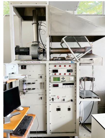
コーンカロリメータ試験装置