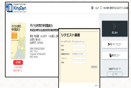
購入リクエストイメージ