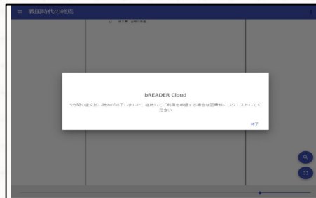
試し読み画面イメージ